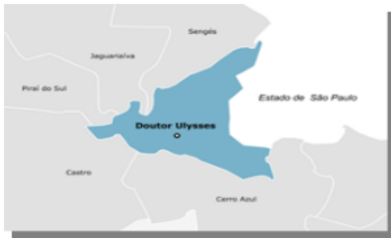
FIGURA 2 - DOUTOR ULYSSES - LIMITES GEOGRAFICOS

Tem seus limites geográficos com os municípios de Sengés, Jaguariaíva, Piraí do Sul, Castro, Cerro Azul, e o Estado de São Paulo.